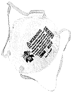
Respirador desechable N95 que purifica el aire

La forma principal como el moho entra al cuerpo de la gente y afecta su salud es respirándolo (inhalación). Los trabajadores de limpieza siempre deben usar un respirador mientras trabajan cerca del moho. Usar el respirador y los filtros correctos y fijarse en que el respirador sea "aprobado por NIOSH." Asegure que un profesional les pruebe la talla y el modelo. Saber cómo ponerse el respirador y verificar que quede sellado cada vez que se lo pongan. Al principio de cada día de trabajo (o más seguido si es necesario), cambie los filtros o póngase otro nuevo respirador N95.