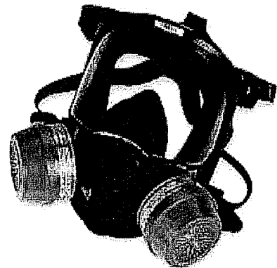
Respirador de cara completa que purifica el aire